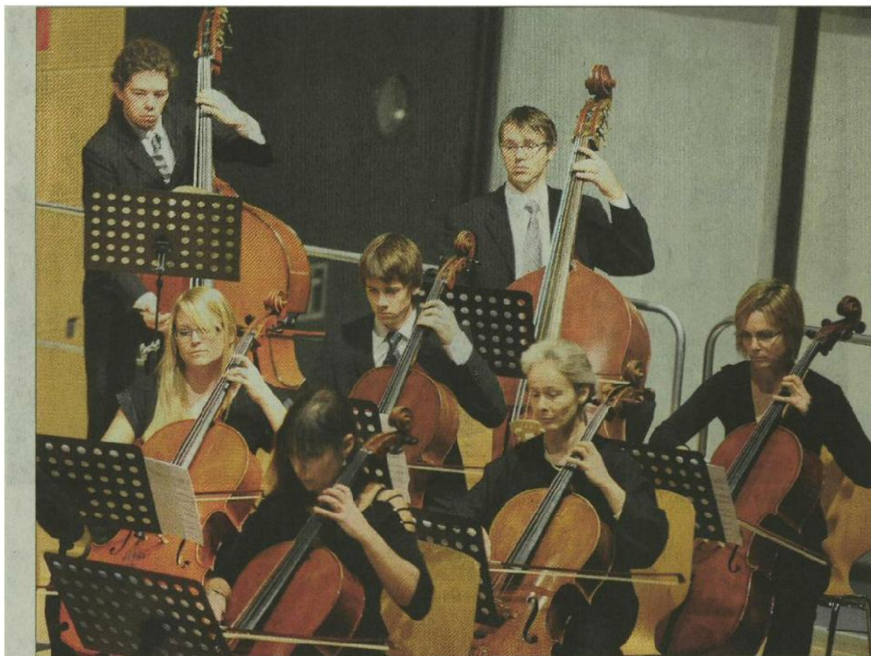
Das Sinfonieorchester Auserschwyz beeindruckte das Publikum mit seiner Darbietung. (Kurt Heuberger)